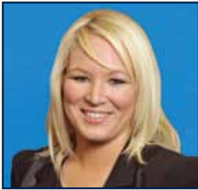
An tAire Michelle O'Neill BTR